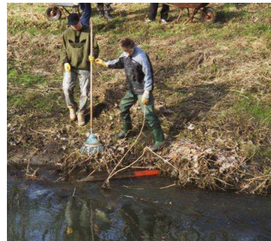
Reinigungs- aktion unserer Jugendgruppe an der Fuhse