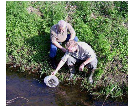
Bachforellenbesatz an der Fuhse/Flothe durch unsere Ge- wässerwarte

Der Fischbesatz erfolgt unter biologisch sinnvollen Gesichtspunkten und wird von unseren ausgebildeten Gewässerwarten an allen Vereinsgewässern durchgeführt.